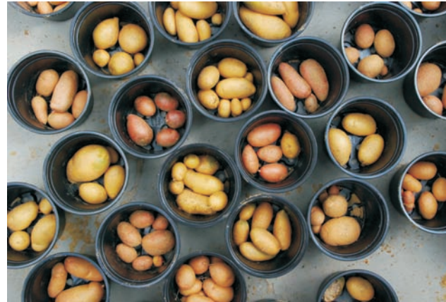
Züchtung schafft Vielfalt: Aus der Nachkommenschaft einer Kreuzung werden Sämlingsknollen anhand der Knollenform und Augentiefe ausgewählt.

Im Projekt soll nun diese Krautfäule-Resistenz mit den für Speisesorten gewünschten Qualitätsmerkmalen kombiniert werden. Die LfL und das JKI führen dazu gezielt Kreuzungen durch und erzeugen eine Vielfalt an Sämlingsknollen. Mehrere Tausend davon werden im Projektverlauf auf den ökologisch geführten Flächen angebaut, geprüft und selektiert. Vielversprechende Klone werden in den darauffolgenden Jahren bei den Ökobetrieben vermehrt und hinsichtlich pflanzenbaulicher Aspekte beurteilt.