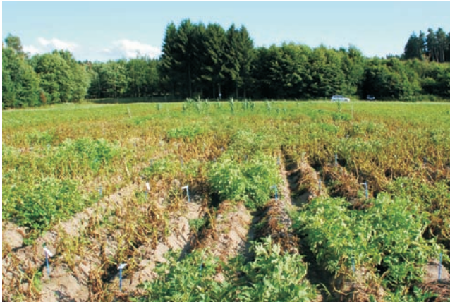
Das Versuchsfeld zeigt die unterschiedliche Anfälligkeit der ausgewählten Kartoffelvarianten gegenüber dem Erreger der Kraut- und Knollenfäule.

Der Erreger der Kraut- und Knollenfäule, Phytophthora infestans , breitet sich bei günstigen Witterungsbedingungen rasant im Kartoffelbestand aus. Der algenähnliche Pilz verursacht vor allem im ökologischen Landbau jährlich hohe Ertragsverluste. Verschiedene Sorten und Stämme unterscheiden sich in ihrer Widerstandsfähigkeit gegen den gefürchteten Krankheitserreger. Um die besten Genotypen zu ermitteln, werden auf drei ökologisch bewirtschafteten Betrieben mehr als 140 Kartoffelvarianten im Feldversuch angebaut. Neben der Phytophthora -Resistenz werden auch pflanzenbauliche Eigenschaften wie Reifezeit, Ertrag, Stärkegehalt und Geschmack untersucht. Der Anbau auf den ökologisch bewirtschafteten Feldern der Biobetriebe stellt sicher, dass die für den ökologischen Landbau relevanten Prüfbedingungen eingehalten werden.